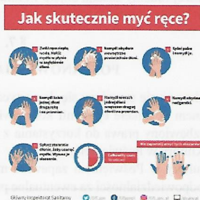
Załącznik nr 5